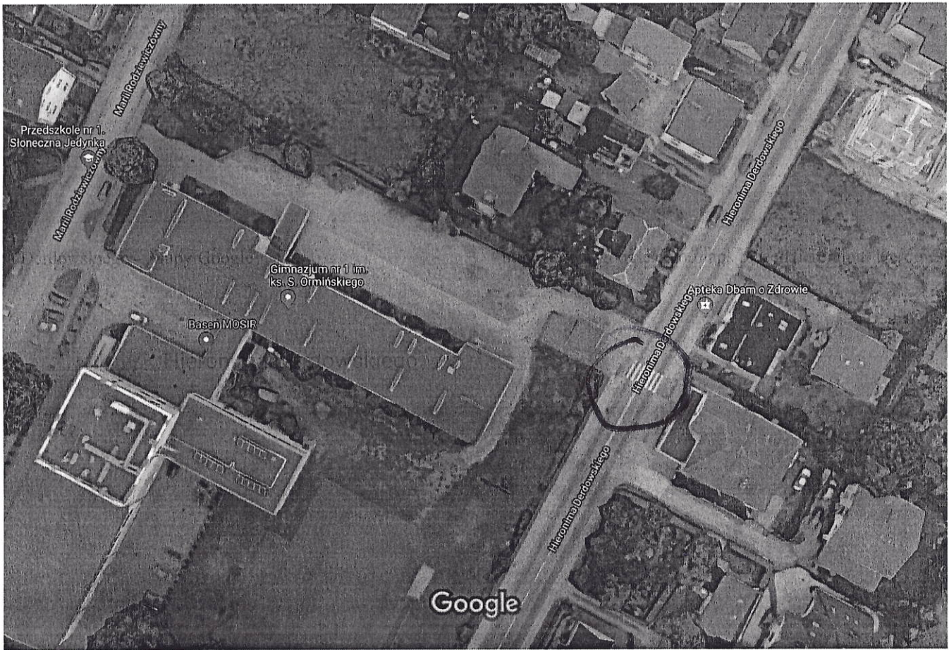
Zdjęcia ©2018 Google, Dane mapy ©2018 Google 10 m