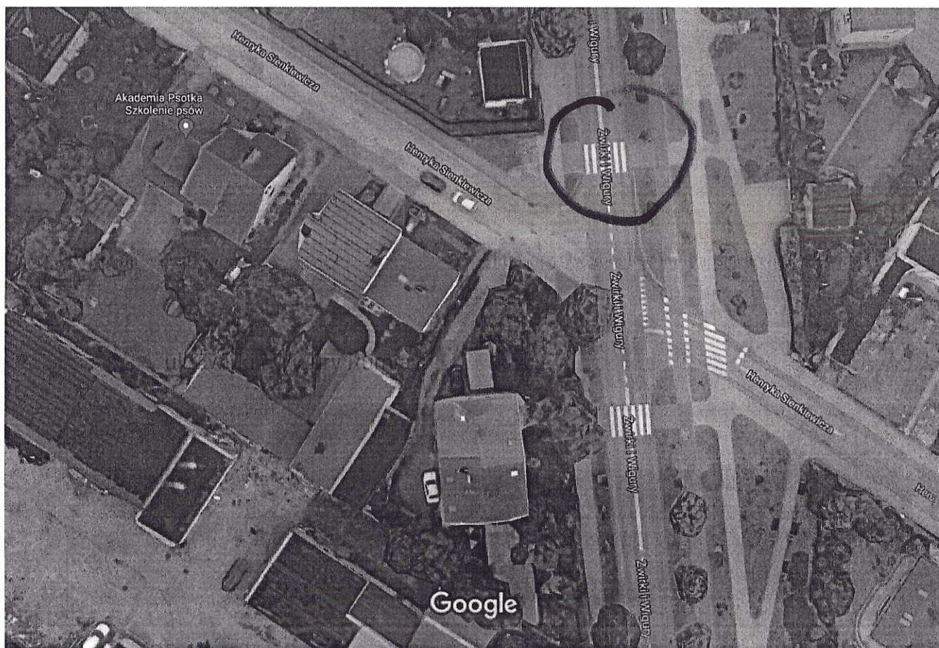
Zdjęcia ©2018 Google, Dane mapy ©2018 Google 10 m